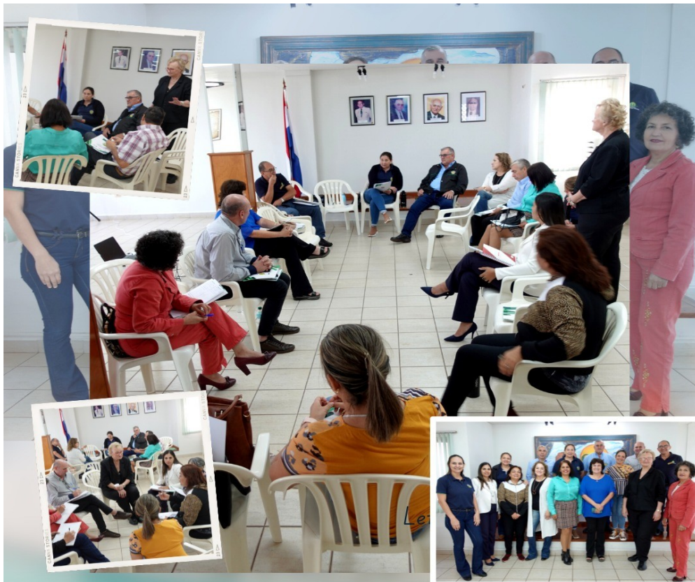
Encuentro Departamental de Comités de Educación